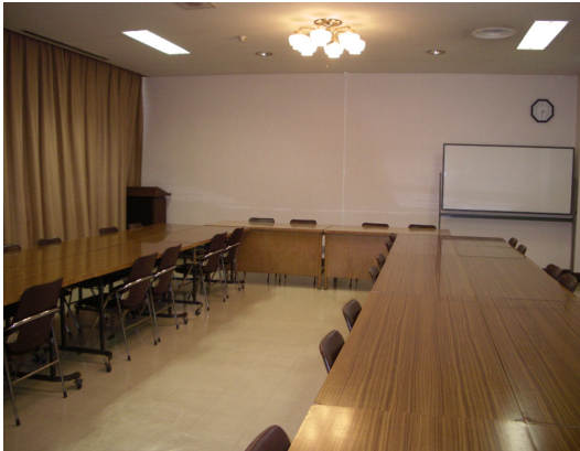
1階 第3集会室 (定員 54名) 面積 72m 2