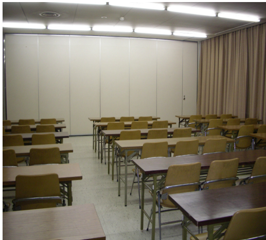
1階 第1集会室 (定員 60名) 面積 72m 2